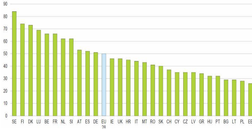
Gráfico 1. Representación de los trabajadores en la empresa